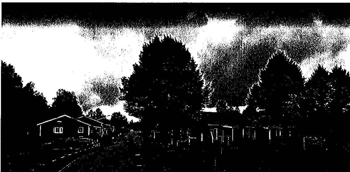
Wallmovägen 27 till vänster och Wallmovägen 22 till höger.

Bedömning av byggnadernas byggtekniska skick, renoveringsmöjligheter och behov av underhåll. Samt prioritering vid eventuella framtida rivningar hänsyn taget till skick, läge, sammanhållen bebyggelse och försörjning värme, VA och el.